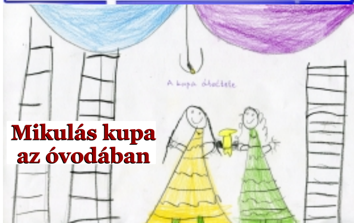
A kupa díjátadó