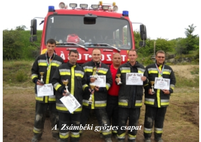
A Zsámbéki győztes csapat

Az országrészi verseny öt hivatásos és két önkormányzati tűzoltóság csapatainak részvételével május 30-án a Pest megyei Zsámbékon volt. Az elméleti felkészültséget tesztlapok kitöltésével bizonyították a résztvevők, a gyakorlati feladatra egy öt állomásból álló pályát jelöltek ki a szervezők egy valamikor katonai bázisként működő domboldalon. A tűzoltást, személymentést és műszaki mentést is magában foglaló életszerű akadályok leküzdése közel egy órába telt minden csapatnak. Az akadályok