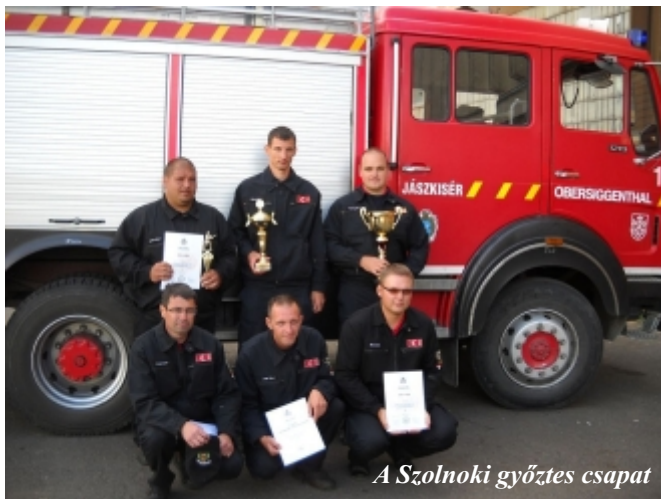
A Szolnoki győztes csapat

A BM Országos Katasztrófavédelmi Főigazgatóság országos felmenő rendszerű szakmai vetélkedőt szervezett, melyre a hivatásos tűzoltó parancsnokságok és az önkormányzati tűzoltóságok csapatait várták. A Jász-Nagykun-Szolnok megyei versenyre május 14-én Szolnokon került sor. Itt a jászkiséri tűzoltók megelőzve Tiszaföldvár és Törökszentmiklós önkormányzati tűzoltóságai csapatait az első helyen végeztek. Az első helyezés mellé megkapták az első ízben különdíjként felajánlott Bendő Mihály kupát és egyúttal jogot szereztek arra, hogy az országrészi döntőn Karcag hivatásos tűzoltóival együtt képviseljék Szolnok megyét.