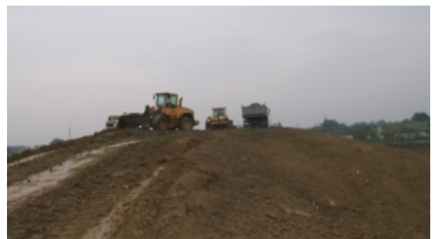
Képek a munkálatokról