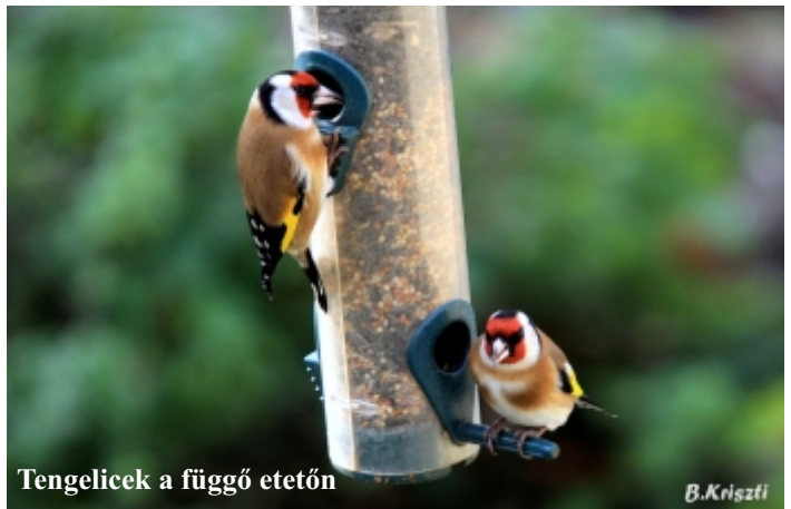
Tengelicek a függő etetőn