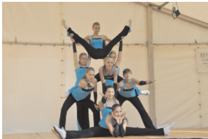
Az aerobic csoport fellépése a Jugendfesten

nagyon szép panorámában gyönyörködhattunk. A piknik után a Böttstein kastélyhoz mentünk, ahol egy nagyon érdekes kiállítást láttunk az energiáról. Ez egy interaktív kiállítás, ahol az ásványi-, szél-, nap-, és víz-, és atomenergia hasznosítását mutatták be nekünk, rávilágítva az utóbbi száz évben megsokszorozódott energia felhasználásra, és az utánpótlás nehézségeire. Az estét a Jugendfest helyszínén töltöttük, akkor volt a hivatalos megnyitó.