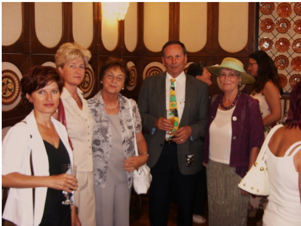
A svájci delegáció a várossá avatási ünnepségen