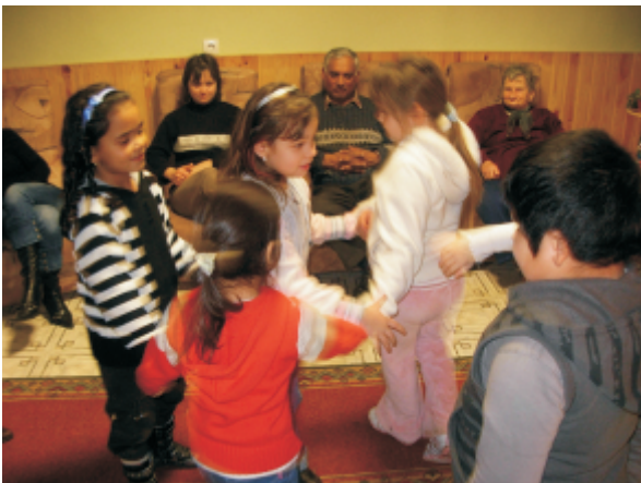
Tóth Magdolna Anyanyelvi mk v

Mind a két helyen meleg szeretettel várták az óvodás kis gyermekeket. A bölcsődében a kicsik megilletődötten figyelték a verselő, éneklő gyermekeket. A közös éneklés hangulatossá tette az együtt töltött időt. Köszönet az Attila úti óvoda Maci csoport gyermekeinek és óvónőjének. Bocskai úti óvodából a süni és halacska csoport sok szép versel, énekkel, körjátékkal örvendeztette meg az időseket. Ezúton is köszönöm a gyermekek segítségét.