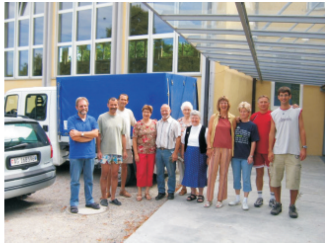
Mindennel készen vagyunk! Niederlenzi barátainkkal a pakolás végeztével.