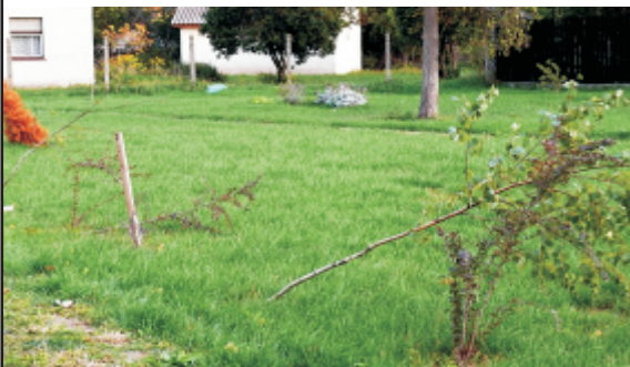
a vandál akciók eredménye