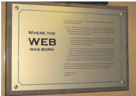
Emléktábla a CERN folyosóján