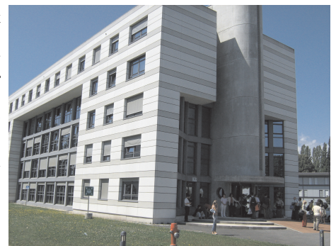
Az intézet szállodájában laktunk

Mert tudják, hogy munkájuk folytatásához szükség van tehetséges fiatalokra, hozzájuk pedig a pedagóguson keresztül vezet az út.