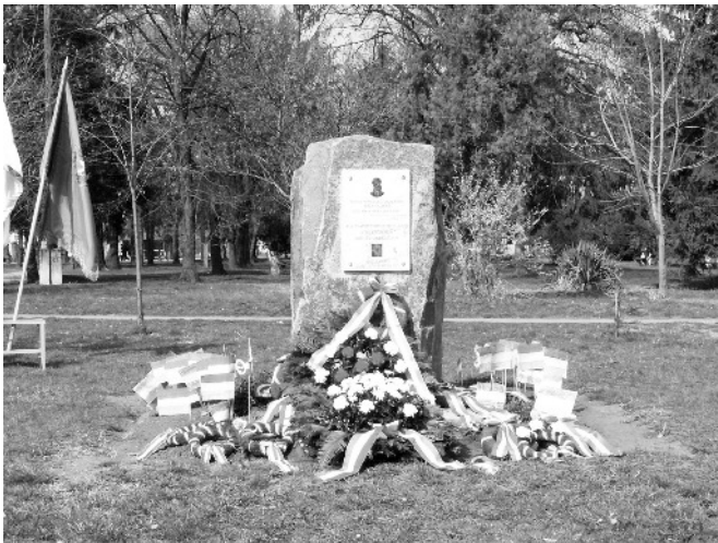
Tisztelt Ünneplő Egybegyűlték! Kedves Jászkiséri Polgárok!

Szeretettel köszöntöm ezen a szép tavaszi napon mindannyiukat, akik eljöttek ide, hogy együtt emlékezzünk.