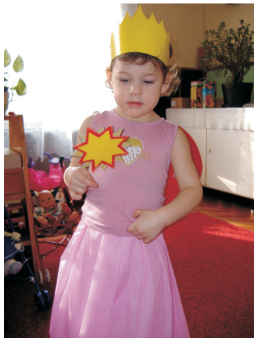
a bölcsođe dolgozói

Ezúton is szeretnénk megköszönni a szülők segítő közreműködését és felajánlásait a farsangi mulatság létrejöttéhez. Ezek után várjuk a tavaszt, a jó időt és a sok-sok napsütést.