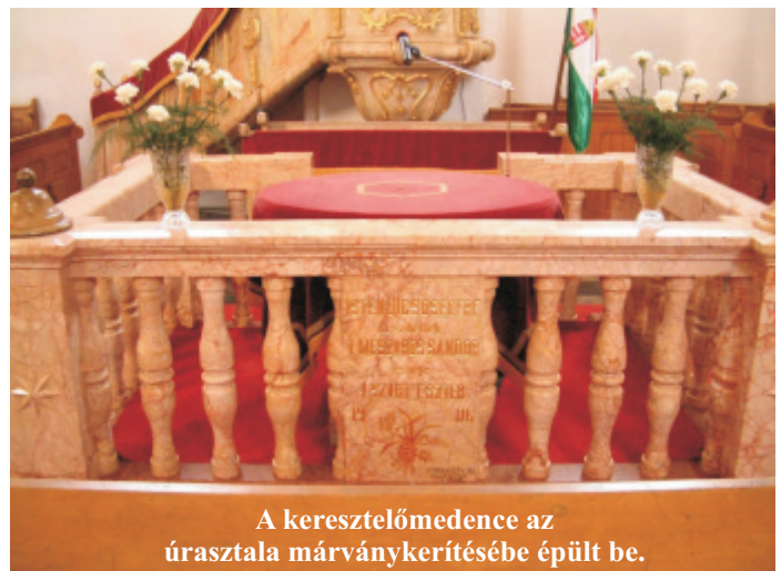
A keresztelőmedence az úrasztala márványkerítésébe épült be.